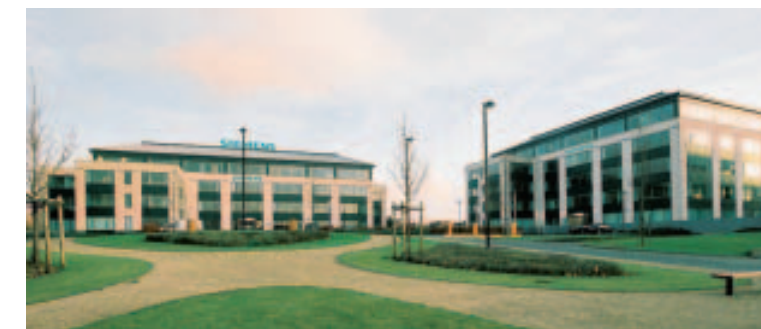
Les bâtiments de Siemens à Anderlecht. ■ SIEMENS

Siemens Belgique-Luxembourg fait partie d'une société multinationale dont les sièges sociaux sont situés à Berlin et Munich. Siemens AG est l'une des plus grandes entreprises au monde d'équipements électriques et électroniques et est active dans les secteurs de l'industrie, de l'énergie et des soins de santé. Avec Siemens IT Solutions and Services, Siemens est l'un des leaders internationaux des solutions et services informatiques. Cette activité couvre l'ensem-